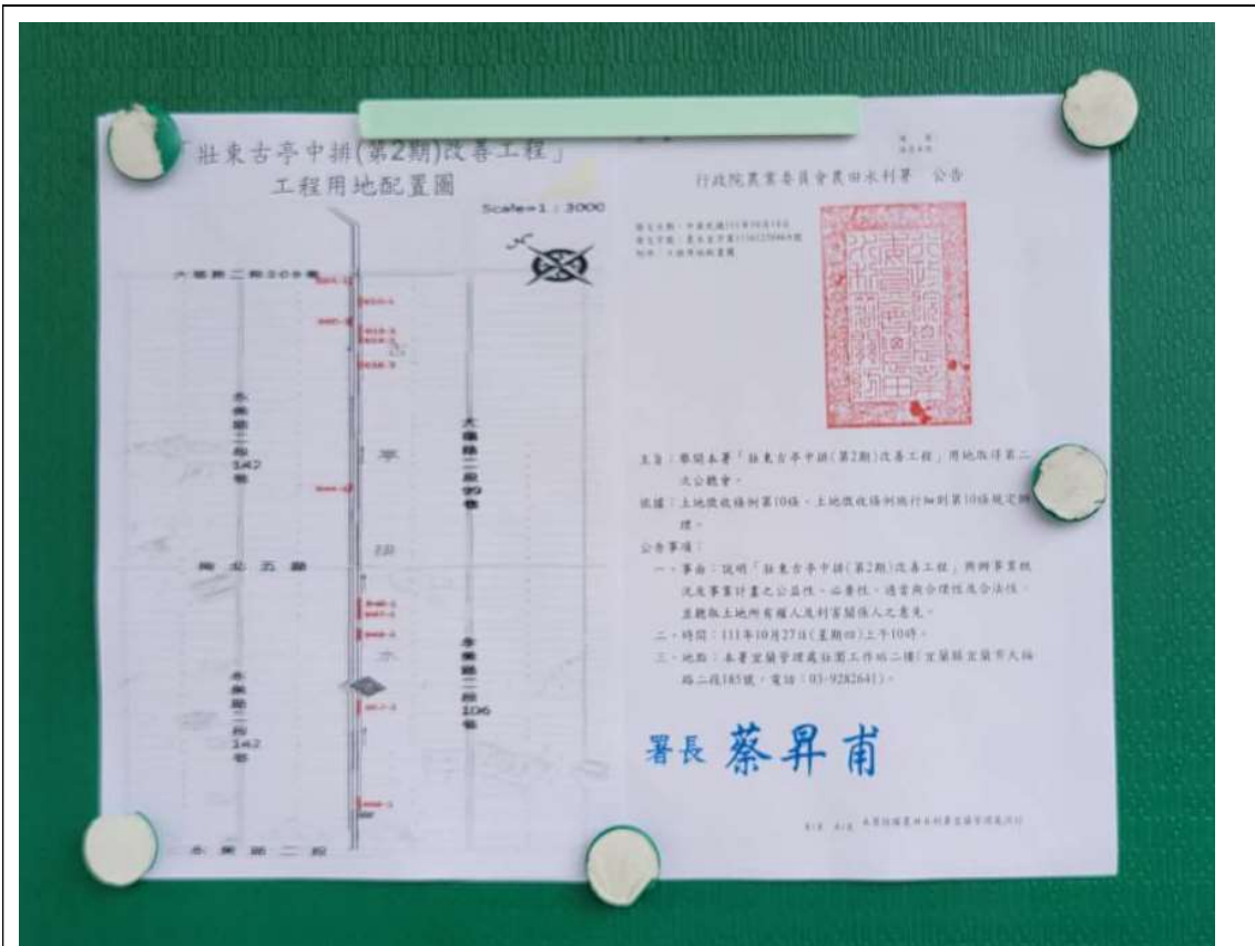
舉開第二次公聽會公告照片