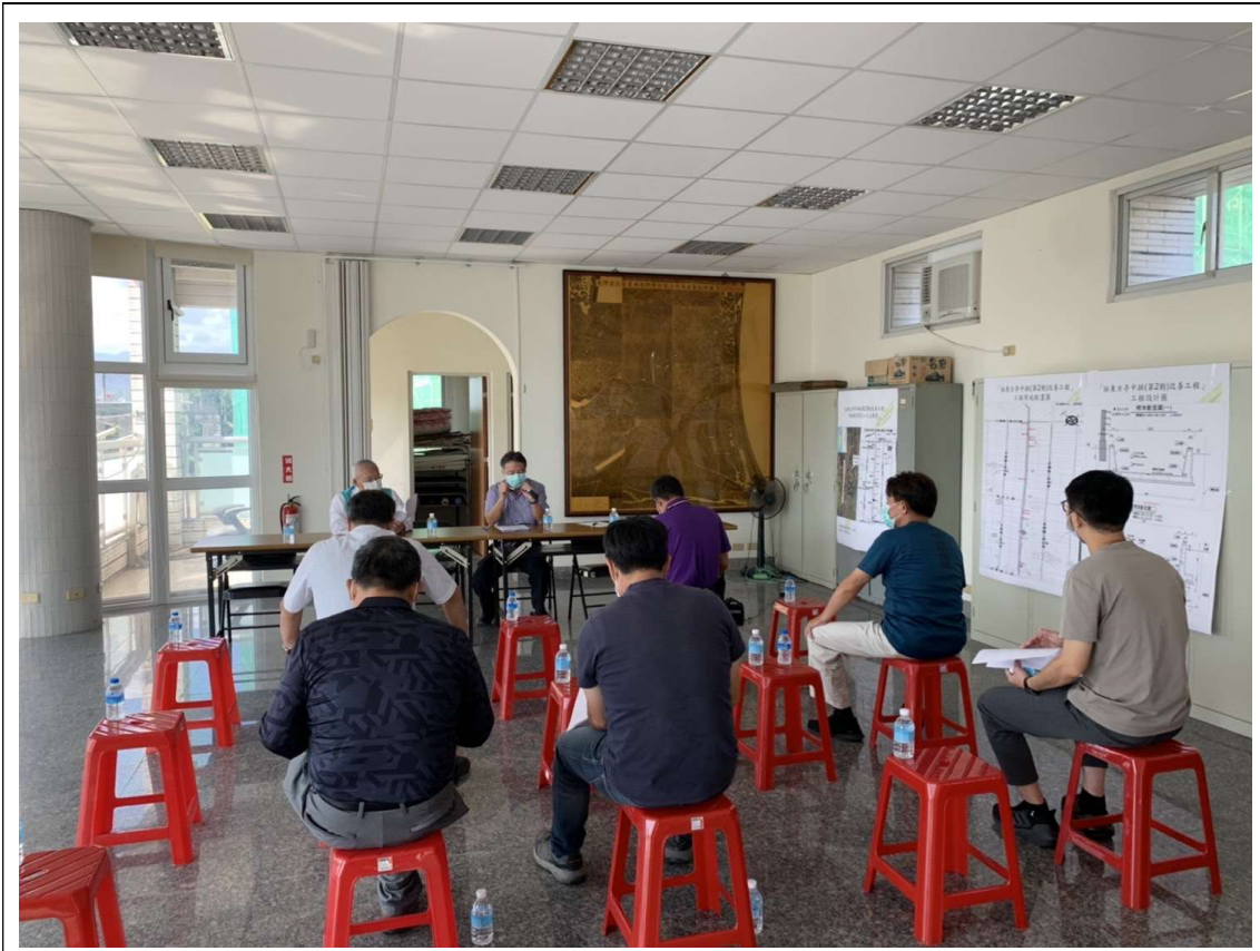
舉開第二次公聽會會場照片 111/10/27