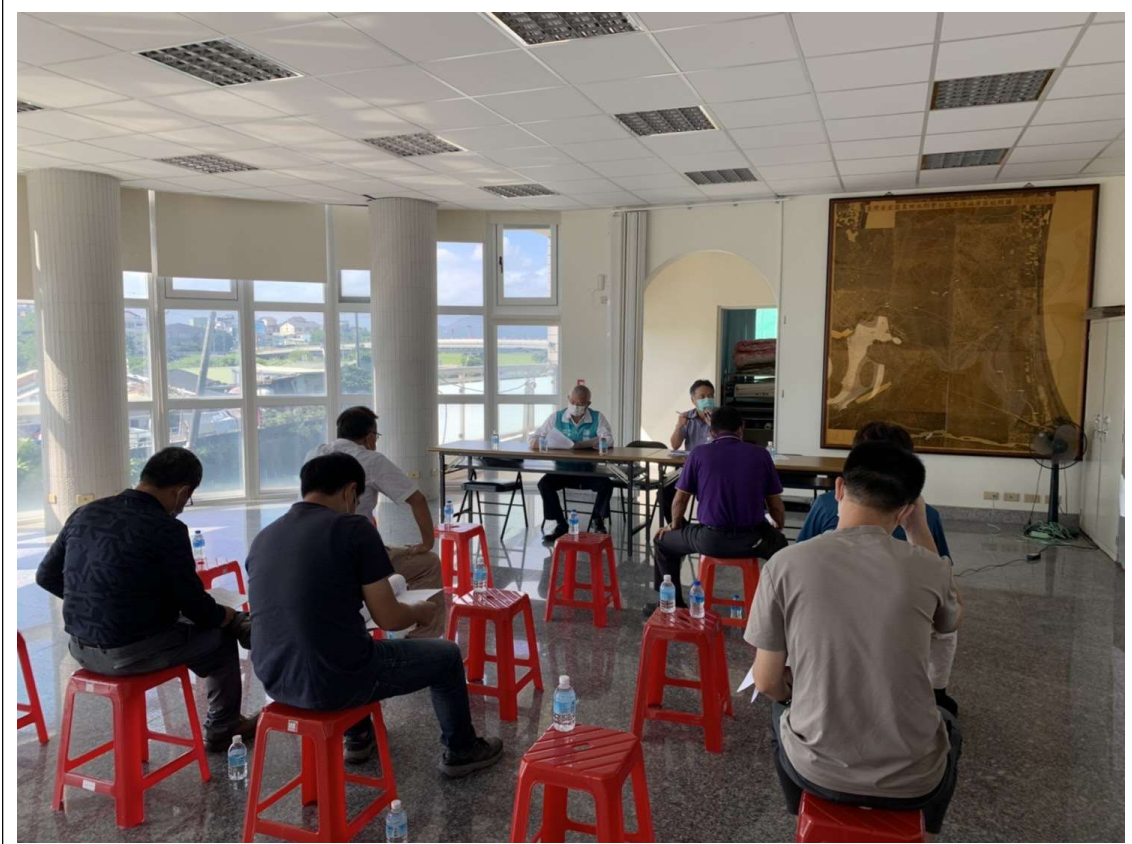
舉開第二次公聽會會場照片 111/10/27