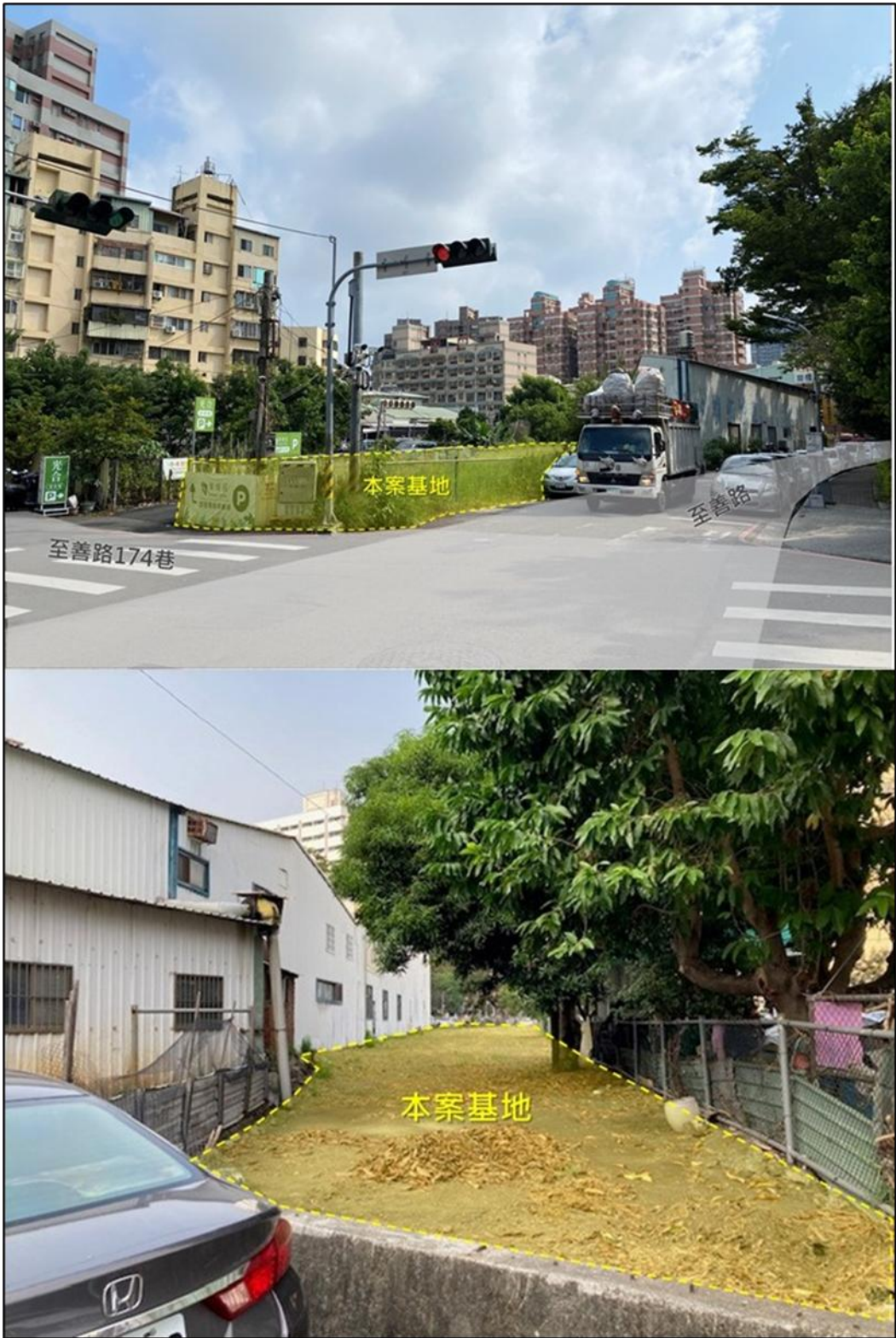
圖2 本案基地現況示意圖